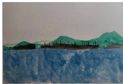
Figura 8. Edifícios de médio porte.