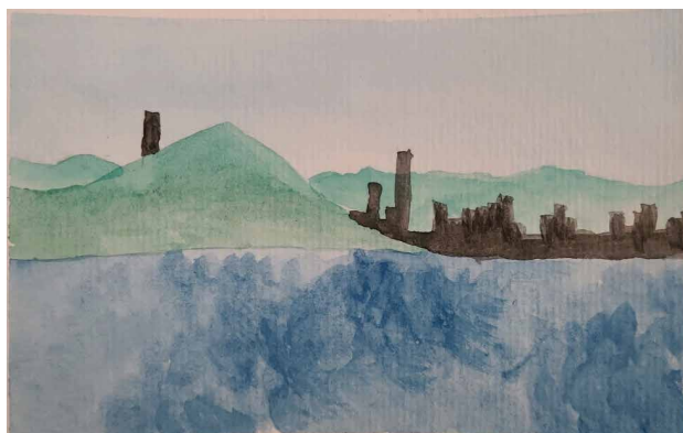
Figura 10. Arranha-céus da cidade de Balneário Camboriú.