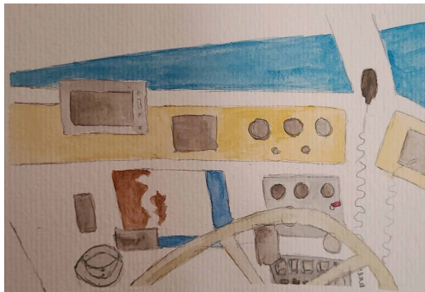
Figura 4. A cabine.

auxiliavam a conduzir o veleiro. Além desses, o comandante utilizava o mapa náutico, que constantemente consultava pelo aparelho celular.