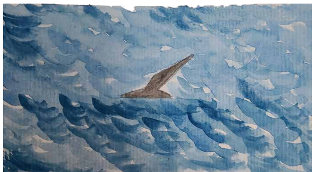
Figura 5. Foca no mar.

Às 8:33 horas da manhã, avistamos no mar uma foca. Pouco tempo depois, uma pequena edificação que destoava da massa de terra, envolta por água de todos os lados: era um farol. Era a Ilha do Arvoredo, também conhecida como Reserva Biológica Marinha do Arvoredo. Ela é composta pelas ilhas de Galés, Arvoredo e Deserta, além do Calhau de São Pedro. Representa uma quintessência da riqueza da vida marinha, ainda pouco explorada do nosso oceano. Apenas pode ser acessada por pesquisadores autorizados para, assim, garantir a sua plena preservação. Para nós, apenas uma silhueta.