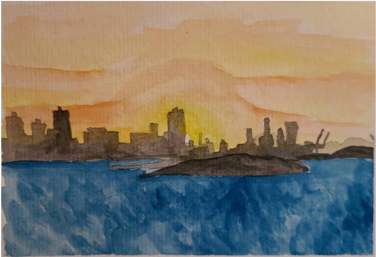
Figura 11. Entrada do Porto de Itajaí.