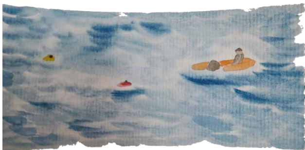
Figura 3. As Boias no Mar.