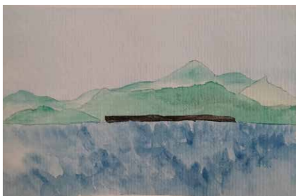
Figura 7. Edifícios baixos. Fonte Autores (2024)

Às 10:44 horas da manhã, estávamos passando a enseada da cidade de Bombinhas. Até aquele momento, em toda a costa catarinense avistávamos edificações de baixos e médio porte, áreas pouco adensadas e uma maior concentração de edifícios nas áreas de praia. Desde Itapema, as edificações começaram a mudar. A faixa de terra apresenta um alto adensamento, com edifícios de grande porte, que alcançaram o topo das montanhas. Ficamos parados nessa posição por um longo período, devido ao lançamento das boias. Desta forma, tivemos a oportunidade de olhar e, assim, produzir o registro crítico-reflexivo sobre essa paisagem costeira.