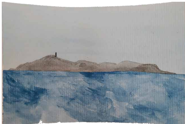
Figura 6. Reserva Biológica Marinha do Arvoredo.