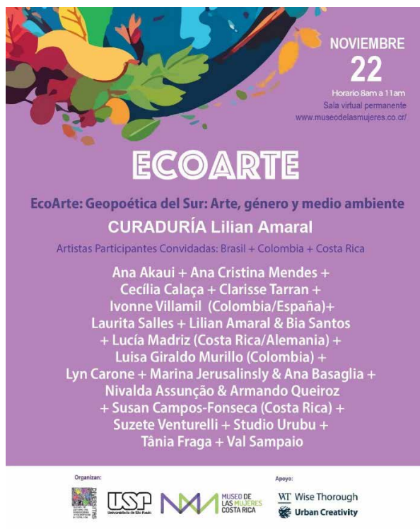
Imagen 2: Flyer de apertura de la exposición virtual EcoArte Geopoética de Sul. Arte, género y medio ambiente.

El Antropoceno es una mutación de profundas y abismales transformaciones en todo el sistema de la Tierra, en todas sus estructuras y, principalmente, en los cuatro grandes niveles. Se entiende que Gaia es un sistema integrado de geosfera, biosfera, antroposfera y tecnosfera. La naturaleza, a su vez, señala Latour, es una noción socio construida y no algo dado. Los agentes no humanos también producen la necesidad de que los humanos describan sus ‘comportamientos’, ‘actividades’, ‘propiedades’, porque los no humanos están pidiendo al humano que defina lo que luego naturalizarán como ‘naturaleza’” (Latour, 2020).