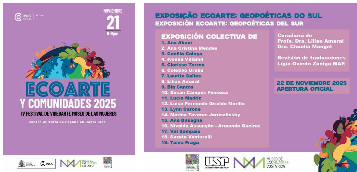
Imagen 3: Flyer de difusión del III Festival de Videoarte Museo de las Mujeres: Ecoarte e comunidades 2025, Art City Tour, CCE, San José/CR, 2025.

viviendo una crisis es pensar que es temporal. Pensar en los impases globales desde la perspectiva de la ecología y el medio ambiente es pensar en los problemas como si concernieran a la naturaleza. Por lo tanto, ignoramos las conexiones desde una mirada de complejos procesos tecnológicos, sociales, culturales y económicos, entre otros que se entrecruzan con la situación climática. Por lo anterior, Latour utiliza el término mutación, no crisis. También utiliza el concepto de clima, que involucra a todos los procesos, y no el de medio ambiente o ecología, que concierne a la naturaleza 4 .