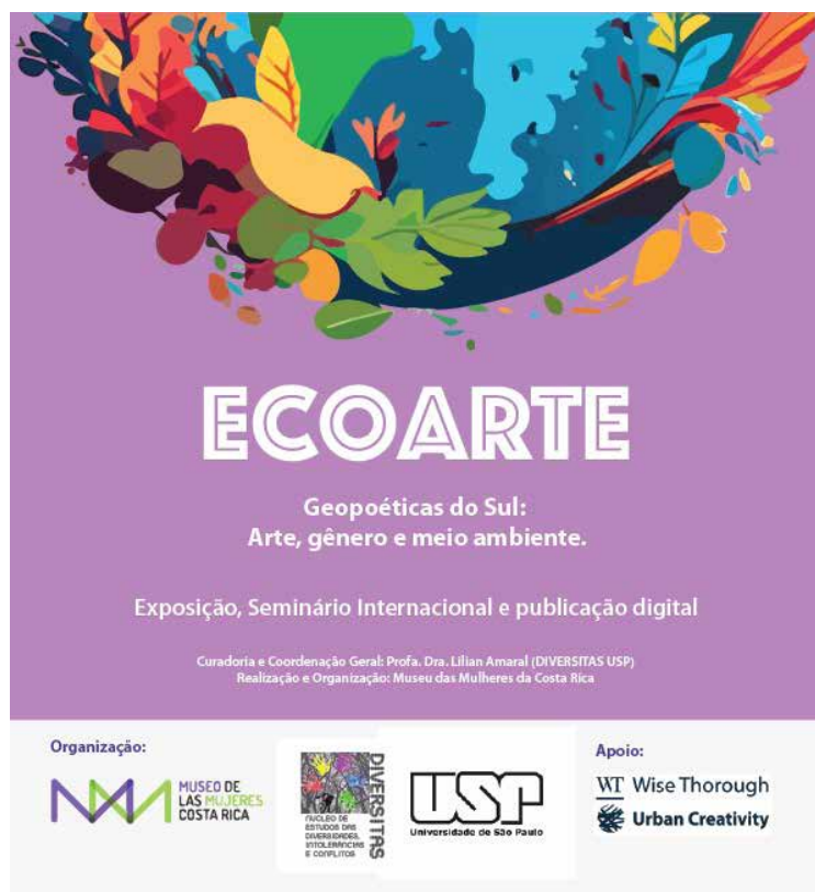
Imagen 1: Flyer de difusión del proyecto EcoArte, con Seminario Internacional, Exposición on line/, Encuentro híbrido presencial y Publicación digital, fruto de la cooperación establecida entre la Universidade de São Paulo, La Universidade de Lisboa y el Museo de las Mujeres Costa Rica.

los entre artistas, investigadores, artistas, ambientalistas y docentes, a través de procesos de creación e investigación ecopoética. La conversación de ecoarte se amplía: ahora involucra directamente cuestiones que articulan el cuerpo, la ecología, la memoria y la tecnodiversidad, al poner en diálogo diferentes cosmoopercepciones y formas de cuidado, para resaltar la interdependencia entre las diferentes formas de existencia humana y no humana.