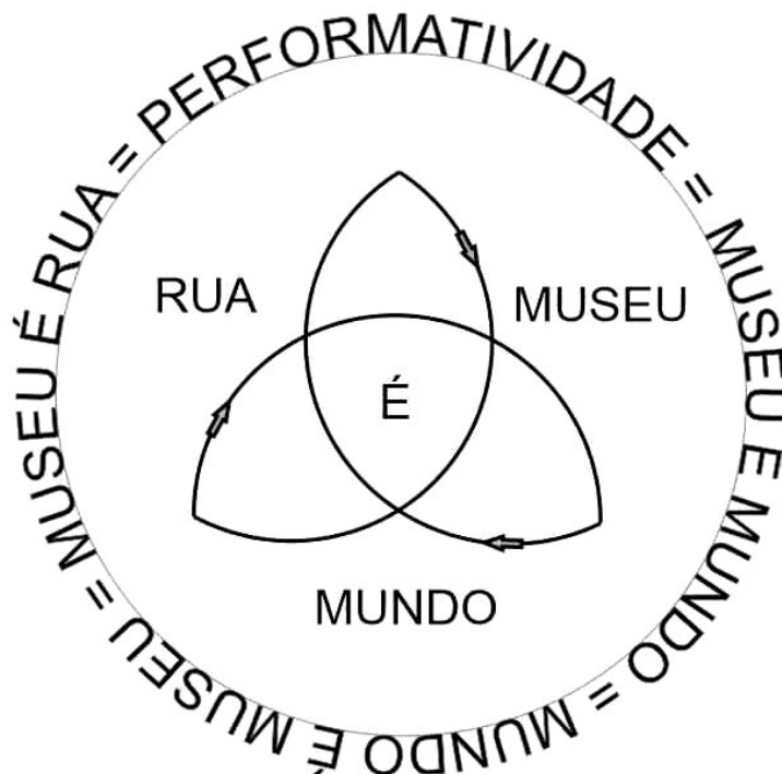
Figura 2: rua = museu = mundo = performatividade

A partir da Figura 2 ilustramos como que o ponto principal das relações É transito cíclico, ou seja, pensando em performance como desempenho de corpos em determinado espaço contextualizado, e em performatividade como ação que busca entendimento das realidades, as ideias de mundo, rua e museu se entrelaçam, desenham e se empenham na performatividade de um território onde as histórias individuais e coletivas se cruzam formando um espaço infinito de construção de memórias e significados culturais; o museu mundo que é a rua: performatividade genuína do ser humano.