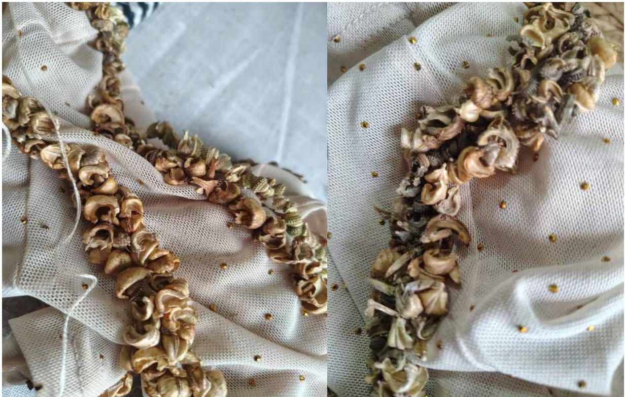
Figura 1. Bordado con semillas de caléndula

en términos eficaces, la descripción corresponde a la realidad y para Barad en términos intra-activos - término que sustituye la idea de interacción - la relación no es de correspondencia, sino que depende de la constitución de las materias (humanas-no humanas) y su entrelazamiento. En un sentido intra-activo la semilla es un dispositivo tecnológico que activa su fuerza gracias al entrelazamiento con la gota de agua.