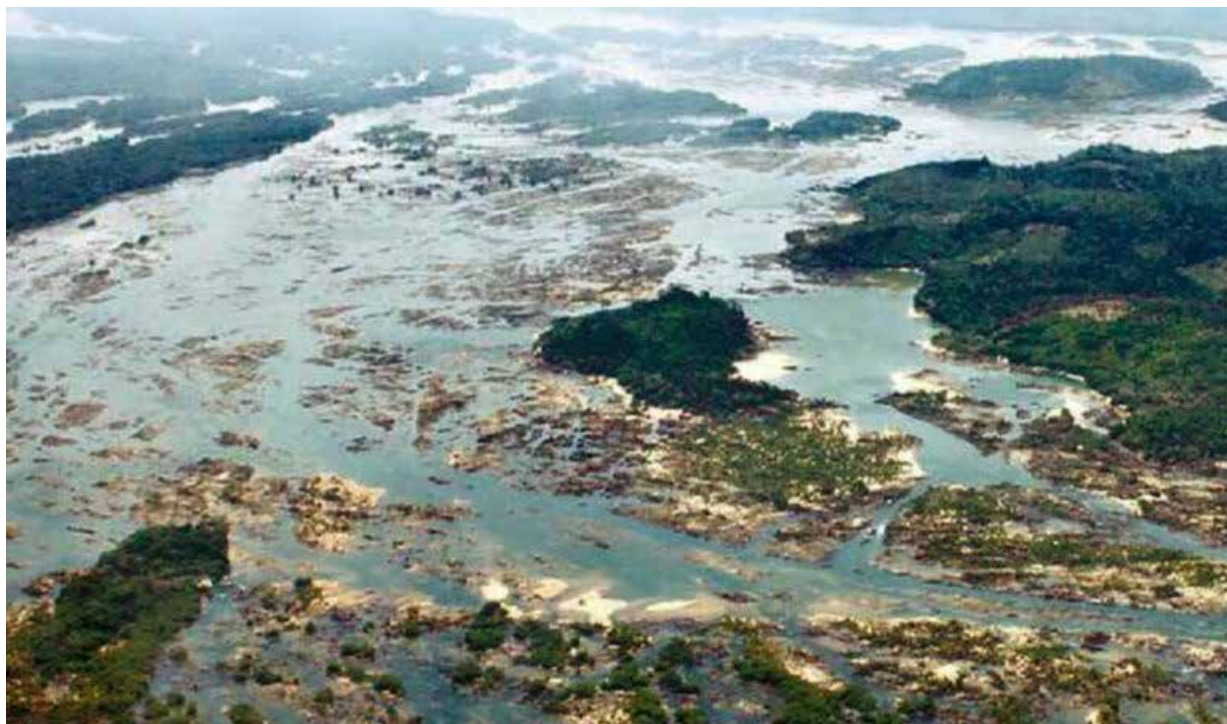
Vista aérea do Pedral do Lourenção pouco antes da iminente derrocada, rio Tocantins no município de Itupiranga-PA.

Algo prenuncia dor neste entrecruzamento de cenas mnemônicas, sejam literárias no caso de Louças de família ou das performances realizadas como investigação lírico-afetiva. Registrados em vídeo e fotografias, os Lençóis vão ganhando contornos e estrutura de peça, mobília, relicário ou portal que ascende às paisagens do passado, às topografias sensoriais, ao presente que se bifurca em memória e pulsões de emolduramentos e passagens (a captura dos vídeos) que os levam a uma promessa de futuro possível e pretendido, a pesar de todos os percalços da condição humana.