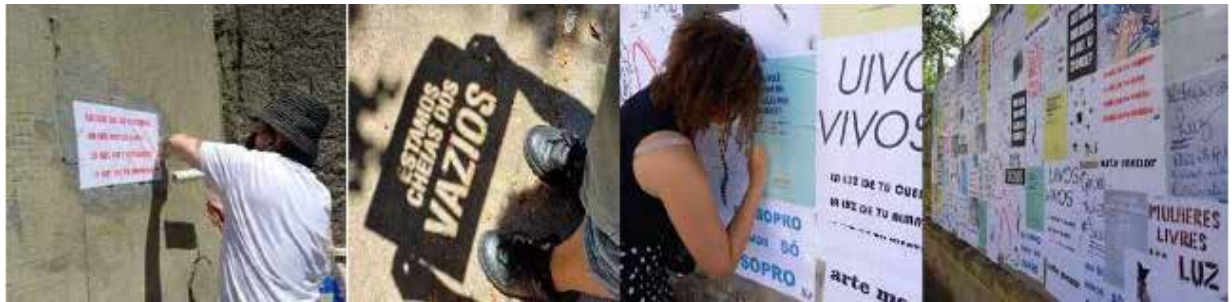
Figuras 6 a 13: Acción del Cortejo sonoro visual por las calles del Barrio Bom Retiro, conectando el Museo de la Lengua Portuguesa al barrio de inmigrantes, con la participación de colectivos activistas para la intervención gráfica con stackers/pegables en las calles, coordinados por Baixo Ribeiro, gestor de la Galeria Choque Cultural, São Paulo y construcción del panel público colectivo instalado delante del edificio del Museo de la Energía, con las frases e imágenes creadas por artistas mujeres de distintos lugares del mundo para la Performance “Donde están las mujeres en el Arte y en la Ciudad?”, diciembre, 2021.

La propuesta fué establecer un camino performativo sonoro-visual, un recorrido que resalte las narrativas femeninas y la presencia de la mujer en la ciudad a través del Arte Urbano y el diálogo entre personas, instituciones culturales y colectivas/os en el territorio de Luz/Bom