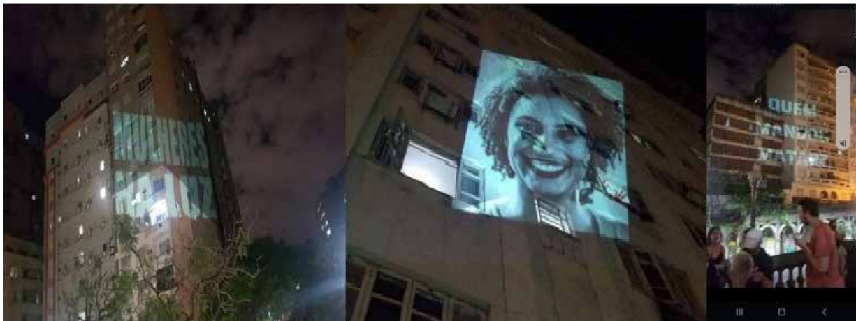
Figura 3: Mulheres na Luz. Proyecciones en el espacio público, ciudad de Porto Alegre. Organización Grupo de investigación Arte e Comunidade, apoyo colectivo Utopia e Luta. Archivo: Cátedra Nômada, DIVERSITAS USP/Lilian Amaral, noviembre, 2021.

La proyección urbana Mujeres en la Luz en la ciudad de Porto Alegre ha sido presentada el 29 de Noviembre de 2021, en la “escadaria” (escalera) de la Avenida Borges de Medeiros, en el centro de la ciudad. La acción es una colaboración con la Cátedra Nômada e iniciativa local del grupo de investigación Ciudadanía y Arte de la UFRGS