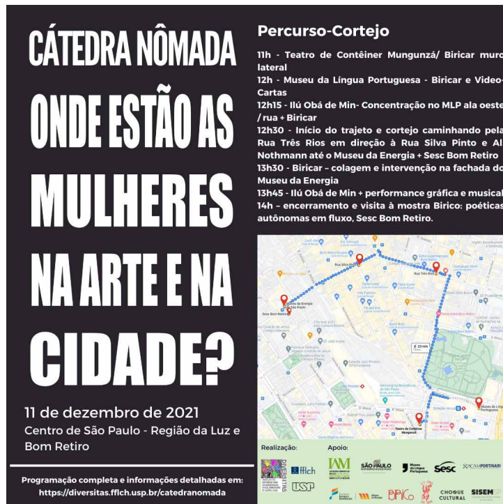
Figura 5: Flyer de difusão de la Intervención “Mulheres na Luz”, DIVERSITAS USP / Galeria Choque Cultural, SISEM – Sistema Estadual de Museus. Imágenes de la Intervención Cortejo Mulheres en la Luz.