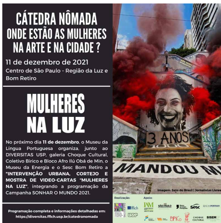
Figura 4: Flyer de difusión de la Intervención “Mulheres na Luz”, DIVERSITAS USP / Galeria Choque Cultural, SISEM – Sistema Estadual de Museus. Imágenes de la Intervención Cortejo Mulheres en la Luz. Fotos: Lilian Amaral. Archivo: Cátedra Nómada / DIVERSITAS USP, São Paulo, Diciembre, 2021.

(Universidade Federal do Rio Grande do Sul) y cuenta con el apoyo del asentamiento urbano Utopía y Lucha.