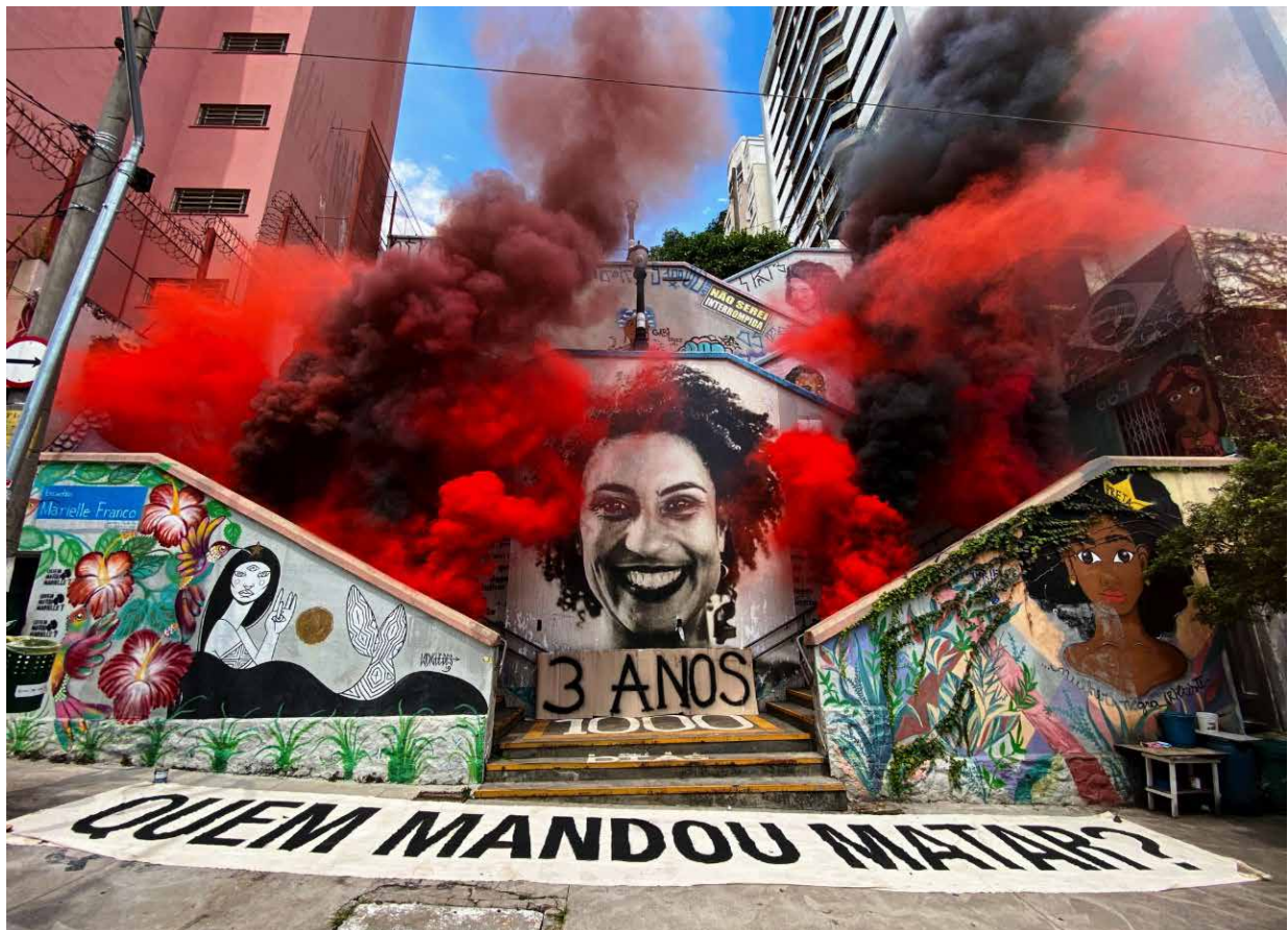
Figura 2: Escalera “Marielle Franco”, intervención urbano artista.

Entre los resultados se configuró un mapa virtual de narrativas vitales en red iberoamericana - video-cartas- que, junto a otras producciones colaborativas, como intervenciones urbanas y procesión, se han performado colectivamente "memorias de lugares y lugares de memoria" urbana y virtual.