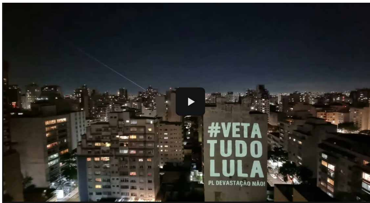
Figura 9. Frame do Vídeo Ato de Luz no Brasil. Marianne Joint, 2025.

A combinação de arte, tecnologia e mobilização social mostrou-se capaz de romper o isolamento das pautas ecológicas, conectando a discussão técnica à sensibilidade cidadã. Ao iluminar o concreto, os artistas iluminaram também as zonas de sombra do processo legislativo. Do ponto de vista pedagógico, o ATO COM LUZ é um modelo de aprendizagem pública em tempo real e em um tempo de emergência climática, a ação inscreve-se como uma obra de arte eco social expandida. Ela demonstrou que, em meio à escuridão simbólica de retrocessos ambientais, a arte pode literalmente projetar luz — não apenas