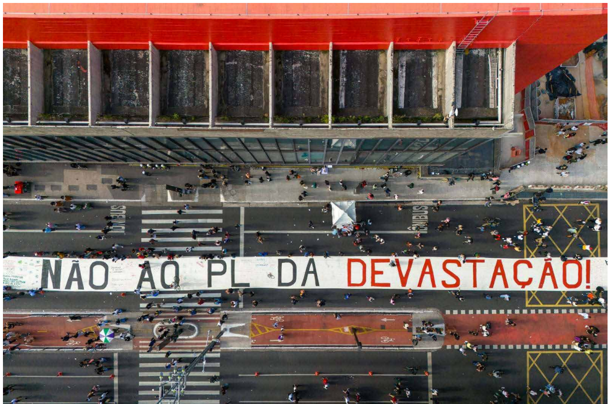
Figura 2: Registro feito por câmera acoplada à drone sobrevoando a Avenida Paulista e a produção coletiva da faixa de 100m, diante do MASP – Museu de Arte de São Paulo, SP, 13/07/2025.

A materialização da ideia exigiu uma logística cuidadosa. Foi organizada uma “vaquinha online” para a compra de materiais e realizadas reuniões paralelas com dezenas de coletivos. Grandes organizações como o MST, Greenpeace, MTST, CUT Verde SP ofereceram apoio humano no dia do ato, garantindo que a montagem tivesse tanto a força do gesto individual quanto a potência de uma coreografia coletiva.