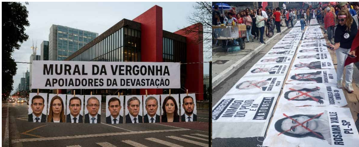
Figuras 10 e 11. Simulação visual e intervenção gráfica para arte urbana instalada na Avenida Paulista após novos retrocessos parlamentares até o presente momento, dezembro de 2025, com os nomes e retratos dos senadores que votaram a favor dos afrouxamentos do licenciamentos ambiental, contra a lei de Proteção Ambiental, colocando o país em situação de riscos iminentes. Ilustração e produção Gustavo Eugênio John.

O sentimento de brasilidade profunda havia sido sequestrado junto com a Bandeira do Brasil verde e amarela em 2018 pela extrema direita. Retomamos (com muito esforço) e ressignificamos a bandeira, incluindo todas as suas “contradições” e policromia – “azuis, brancos, amarelos e verdes”. Estamos exercitando a democracia com todas as suas vozes, sonoridades, tintas, diálogos e resistências que a definem em sua pluralidade e diversidade. Com crescente e resiliente maturidade política, institucional e diplomacia internacional estamos pavimentando uma via democrática pautada na luta, na escuta e na resistência criativa contínuas que vão se fortalecendo enquanto miram e reinterpretam o passado, com uma visada crítica, projetando o futuro coletivo e construindo o presente com beleza, indignação, integridade e afeto.