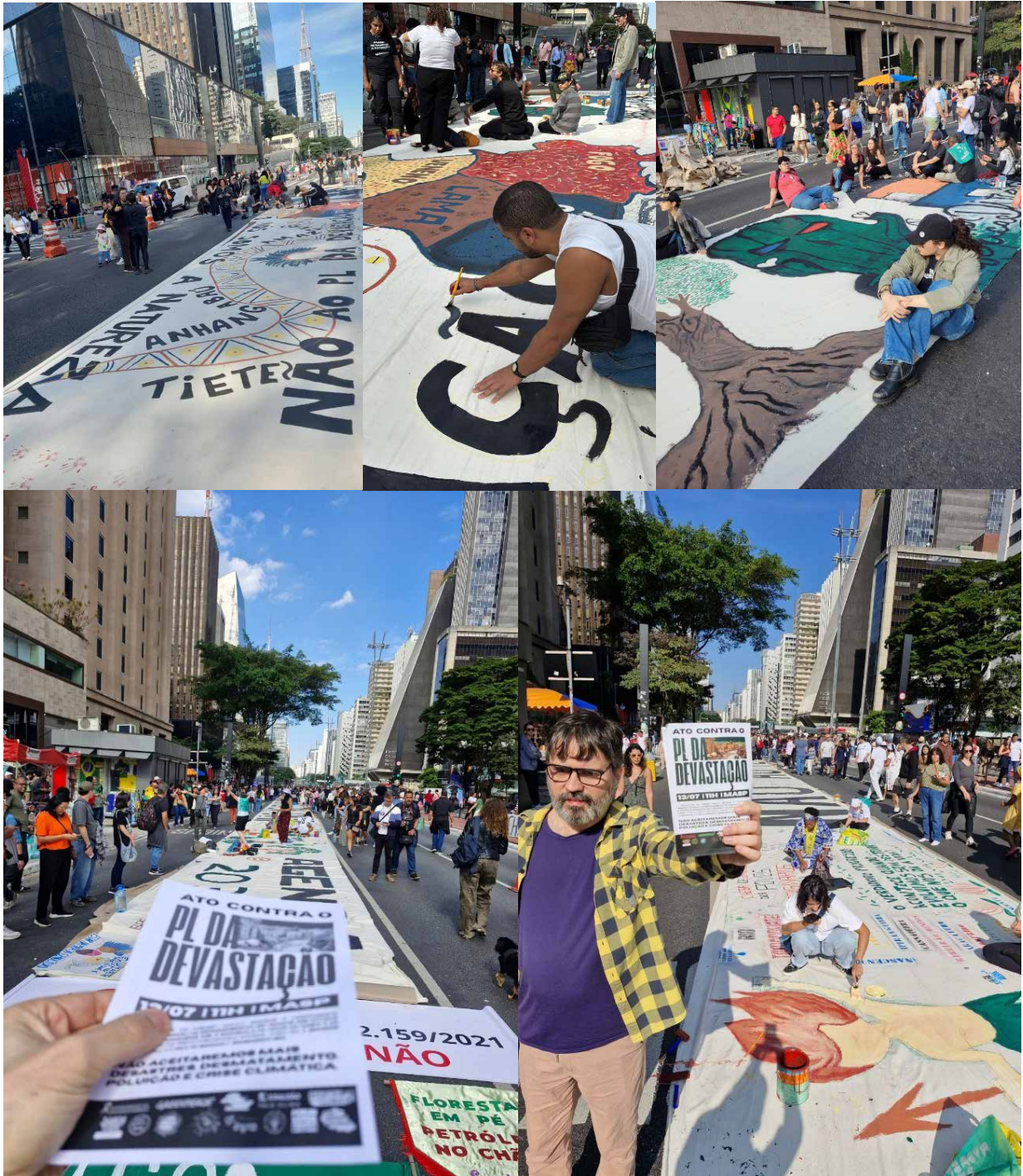
Figuras 3, 4, 5, 6 e 7: Pintura ecopoética – Faixa de 100 metros #ContraPL da Devastação na Avenida Paulista. Pintura coletiva e ação política, ativismo ambiental, julho 2025.