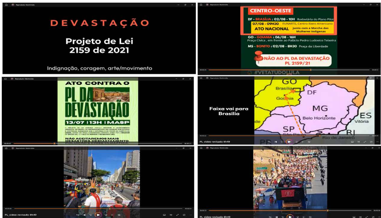
Figura 8: Frames capturados do vídeo registrando os deslocamentos da Faixa contra o PL da Devastação por diversos Estados e Atos Políticos no Brasil. Vídeo e fonte: Armando Kokitsu, 2025.

2159/2021. Ambientalistas, jornalistas e ex-ministros passaram a citar o “ato da faixa de cem metros na Paulista” como exemplo de resistência democrática e criatividade civil. Na semana seguinte, o tema do veto ganhou espaço ampliado em colunas políticas e editoriais – um reposicionamento do debate dentro da esfera legislativa. O gesto poético tornou-se também um ato pedagógico dirigido ao Congresso. Ele mostrou que a sociedade civil brasileira é capaz de expressar complexidade política sem recorrer à violência, ensinando que a arte pode ser instrumento de argumentação ética. A performance estética da faixa produziu um novo tipo de “audiência pública”: não dentro do parlamento, mas sobre o asfalto, na ágora urbana cotidiana.