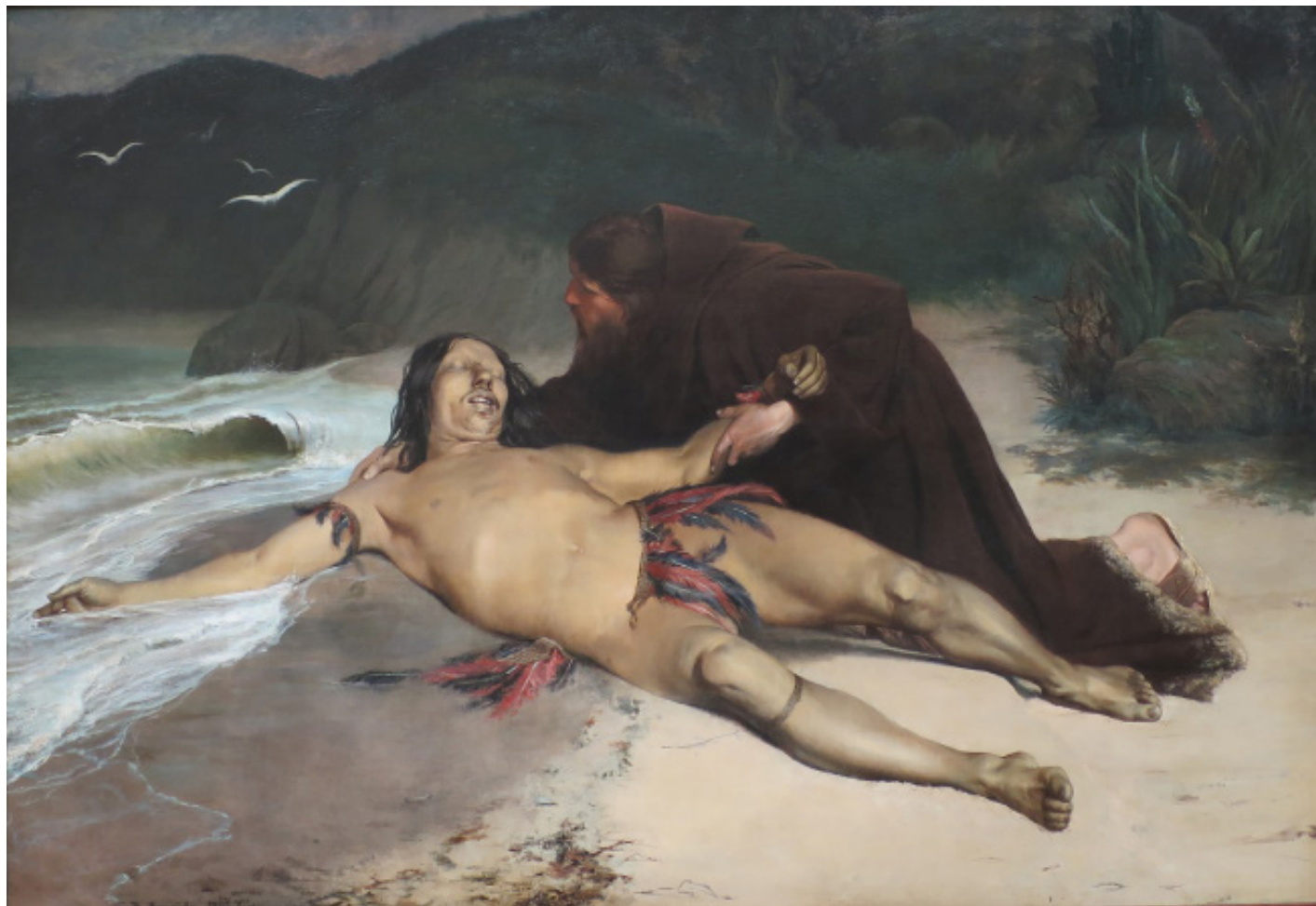
Fig. 7 – Rodolfo Amoedo, O Último Tamoio , 1883. Óleo s/ tela, 180,3 x 261,3 cm. Museu Nacional de Belas Artes (MNBA), Rio de Janeiro.

E assim, Aimbire tira a própria vida. O homem que acolhe o corpo do índio na Baía de Guanabara, observado na pintura, é o padre José de Anchieta. Solicitara-se a sua presença para negociar o estabelecimento de um acordo pacífico entre brancos e nativos. Apesar do desenlace funesto, o tom redentor do suicídio de Aimbire contém