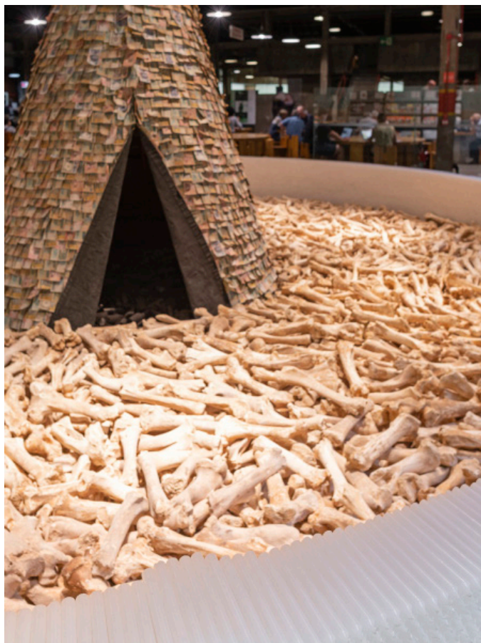
Fig. 15 – Cildo Meireles, Olvido , 1987-9. Tenda indígena, 6 mil cédulas de países americanos, três toneladas de ossos de boi, 69300 velas de parafina, carvão vegetal e som, 460 cm de altura e 800 cm de diâmetro. Detalhe da instalação no SESC Pompeia, São Paulo, 2019.

A parede circular construída com velas, que contém ossadas assim como uma fonte resguarda a água, explicita o teor nefasto da participação da religião cristã nos processos de colonização. Além de encobrir suavemente a imagem drástica do genocídio, a habitação indígena construída com notas de dinheiro, no meio da instalação, relaciona a igreja católica à ganância económica. Com este tipo de comentário, Meireles não incrimina um representante da igreja da época. Com esta disposição, ele apenas evidencia relações que a humanidade em geral reconhece como recorrentes no esquema da colonização. Do mesmo modo, o artista não realiza uma crítica aos católicos e tampouco à identidade destes fiéis, se não que pondera problemas na conduta desta instituição que podem ser reconhecidos por