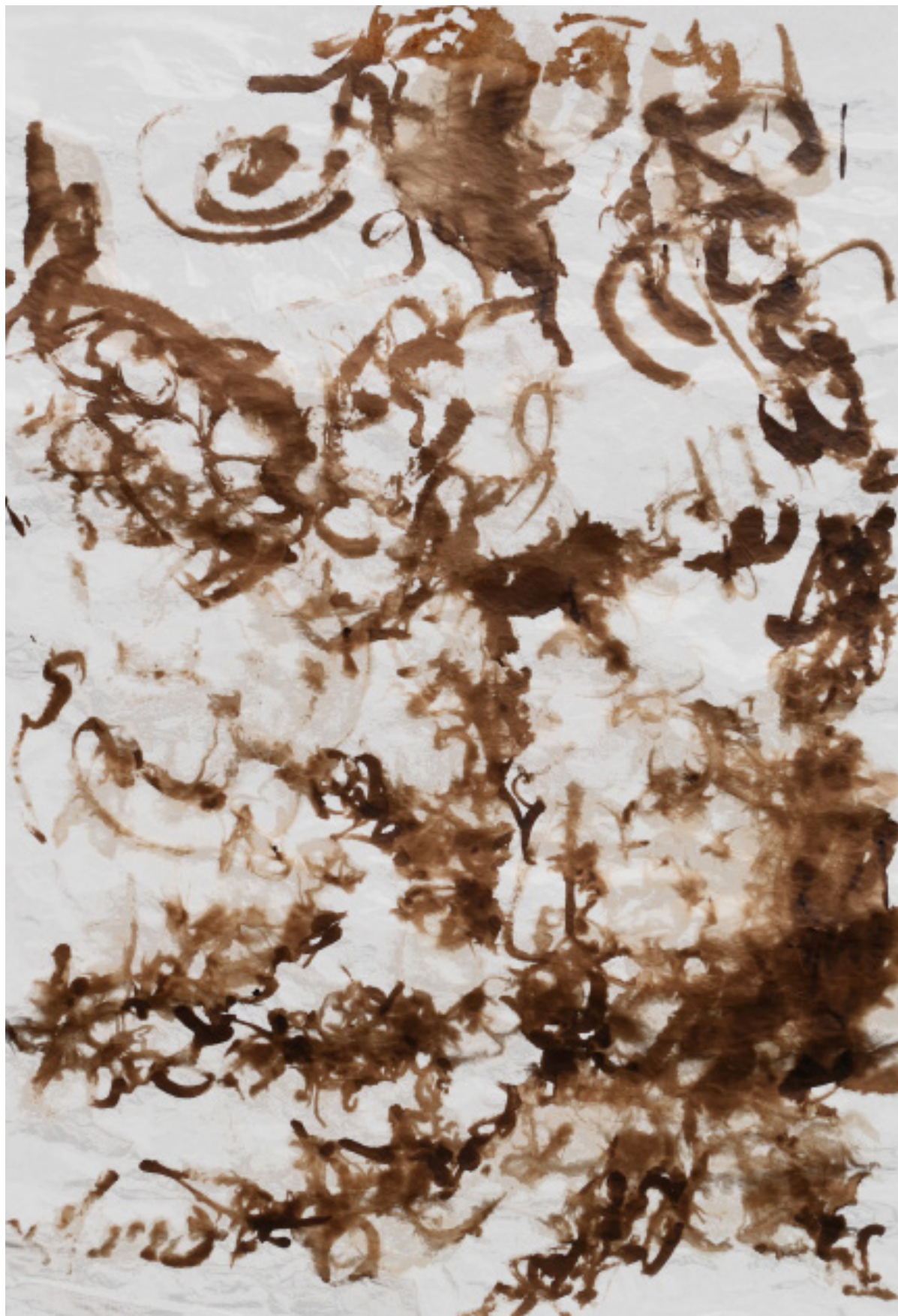
Fig. 5 – Letícia Larín, Certidão de Nascimento do Índio Brasileiro (Fol. 15f) , 2016. Nanquim s/ papel de arroz, 84,1 x 59,4 cm.