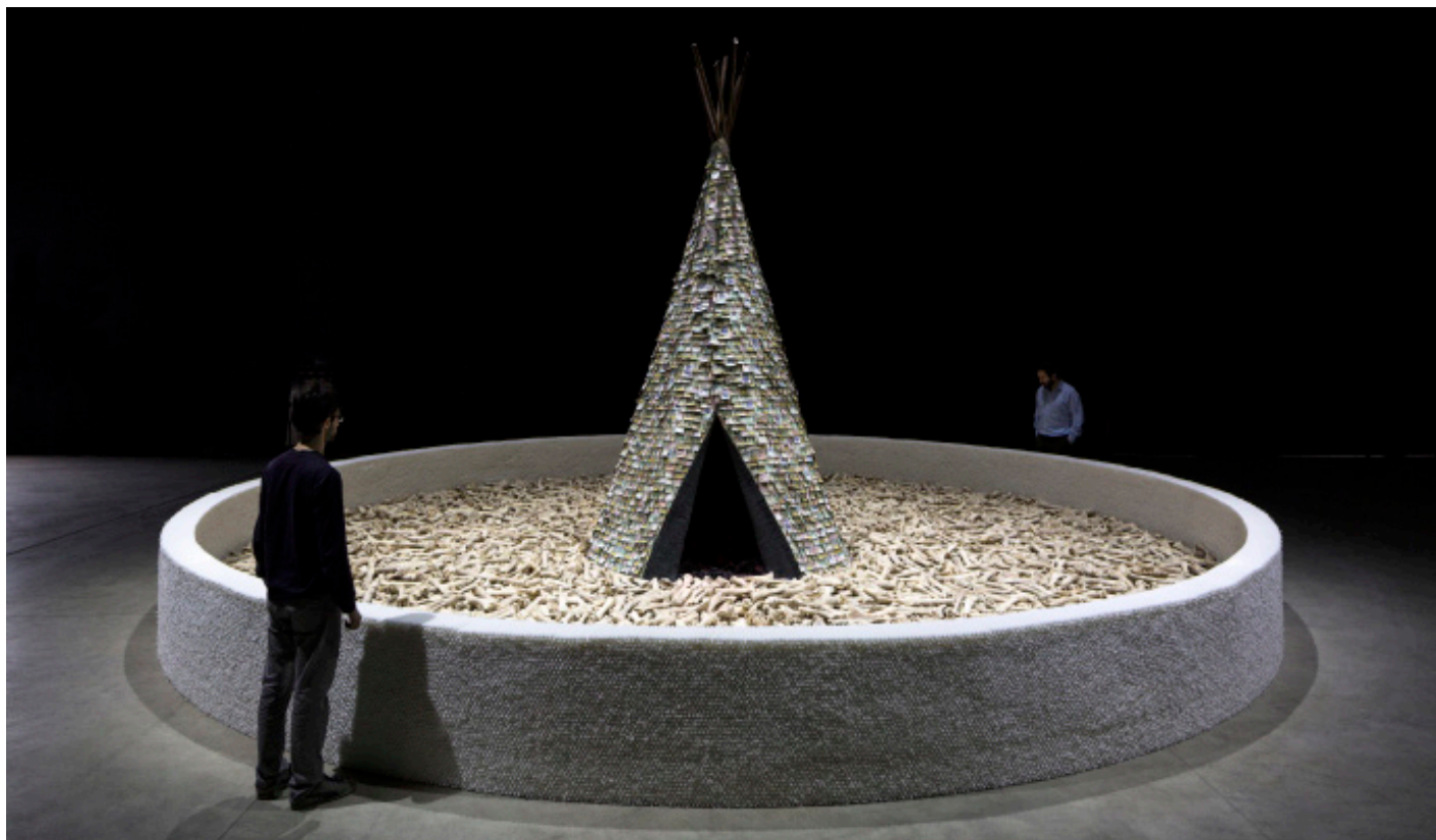
Fig. 14 – Cildo Meireles, Olvido , 1989. Técnica mista, aproximadamente 330 x 615 cm. Vista da instalação em Fondazione Hangar Bicocca, Milão, 2014.

Como segunda tipologia «metacultural» há o tratamento de temas históricos, pela constatação de posturas antagónicas – como vítima e malfeitor, opressor e oprimido, etc. Mas nestes casos, devido ao distanciamento temporal, as perspectivas enraizadas em preceitos morais já não conjugam esquemas de disputa combativa, se não que resultam em apreciações de juízos históricos generalizados, apresentando um tom impessoal. Em termos genéricos, reconhecem-se com clareza as instâncias “benfeitoras” e “malignas” envolvidas nos enredos, ao mesmo tempo em que se compreendem os motivos e as razões que mobilizaram as divergentes atuações. Sendo assim, não há a disposição de um discurso moralista, se não que a de quadros históricos complexos e ambíguos. No caso do presente exemplo, a obra Olvido (Fig. 14 e Fig. 15) de Cildo Meireles, percebe-se que o tratamento destes temas, conforme óticas que já se tornaram um lugar-comum, não deixa de provocar, na audiência, uma experiência própria de autorreflexão.