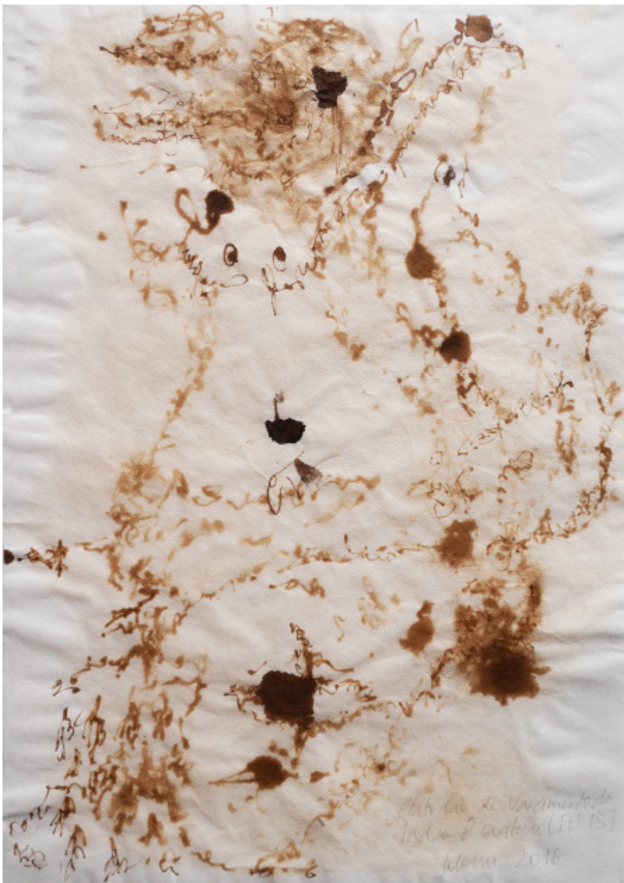
Fig. 4 – Letícia Larín, Certidão de Nascimento do Índio Brasileiro (Fol. 14v) , 2016. Nanquim s/ papel de arroz, 29,7 x 21 cm.