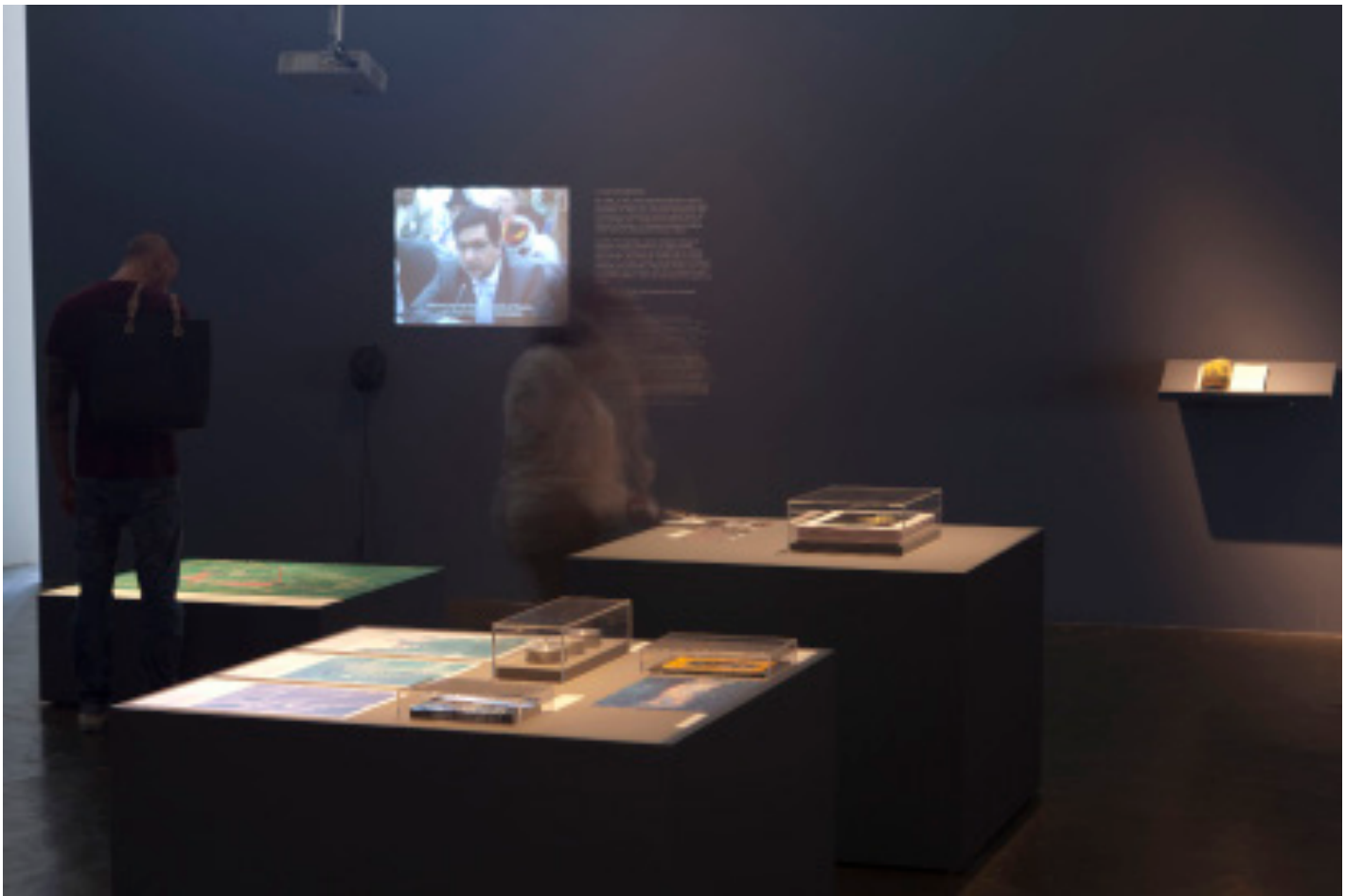
Fig. 12 – Ursula Biemann e Paulo Tavares, Forest Law – Selva jurídica , 2014. Mapas, imagens, livros e amostras de solo. Vista da instalação na 32ª Bienal de São Paulo, 2016.

três obras artísticas brasileiras contemporâneas, que exemplificam três estratégias de trato com contextos de alteridade, segundo uma ótica metacultural – não delineada por estereótipos. Como uma primeira tipologia há a abordagem secundária do “outro”, junto a um argumento principal que sonda um interesse global. A obra em questão é um projeto colaborativo entre Ursula Biemann e o arquiteto e urbanista Paulo Tavares, Forest Law (Fig. 12 e Fig. 13).