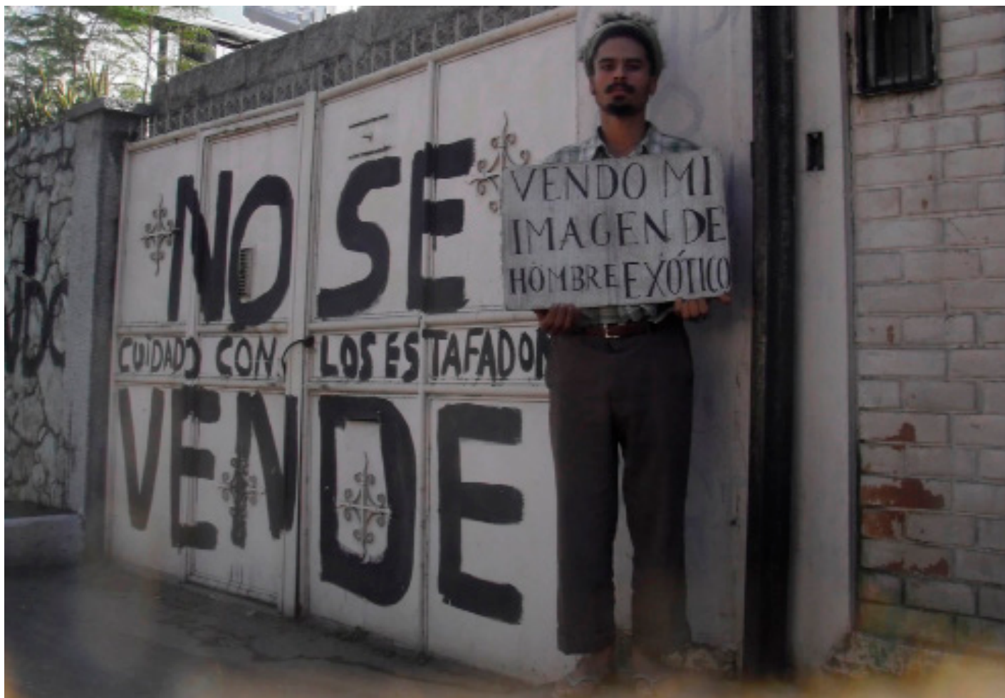
Fig. 11 – Paulo Nazareth, Sem Título , da série Notícias da América , 2011-2. Impressão fotográfica s/ papel algodão, 45 x 60 cm.

Esta atenção a ocorrências alheias ao âmbito da arte pode ser útil à arte que, seguindo o pensamento de Claire Bishop que parafraseia o de Nicolas Bourriaud, concebe critérios de avaliação não apenas estéticos,