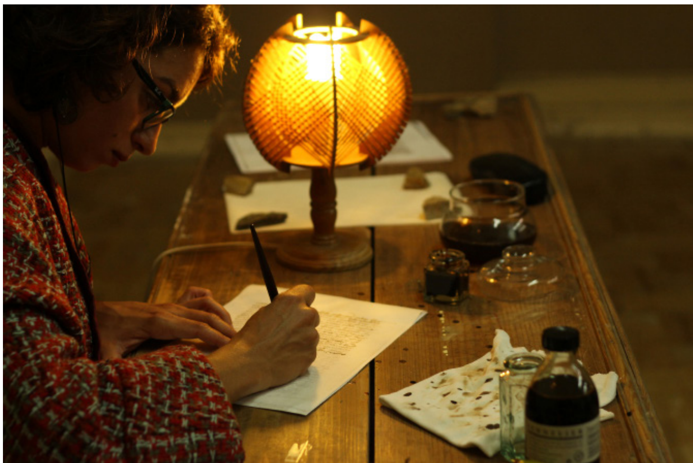
Fig. 1 – Letícia Larín, Certidão de Nascimento do Índio Brasileiro (Pêro Vaz de Caminha) , 2016. Vídeo registro de performance de 40 horas realizada em dois dias consecutivos no Atalaia Artes Performativas 2016, Almodôvar, 1h 30'.

“incorporar” a visão do escrivão que a concebeu, de modo a tentar visualizar a imagem do indígena inaugurada em sua mente, foi realizado um experimento artístico através da caligrafia. Neste, a ação contínua de redesenhar os 28 fólhos da carta (Fig. 1) permitiu a apreensão da cadência, ritmo e ondulação de Pêro Vaz de Caminha, mobilizando noções sensíveis quanto ao seu modo de ser. Além disso, para contribuir a este tipo de “imersão em Caminha”, a performance foi acompanhada pelo áudio de um vídeo, no qual portugueses leem o conteúdo, da carta, escrito com o alfabeto romano e em português arcaico (Fig. 2). O frequente, por vezes estranhamento e por vezes embaraço, das pessoas na leitura oral, e decorrente das diferenças entre o português atual e o arcaico, parafraseou, pelo tempo, o conflito no encontro de culturas distintas – em vários momentos, também, os participantes manifestaram agradáveis expressões de surpresa.