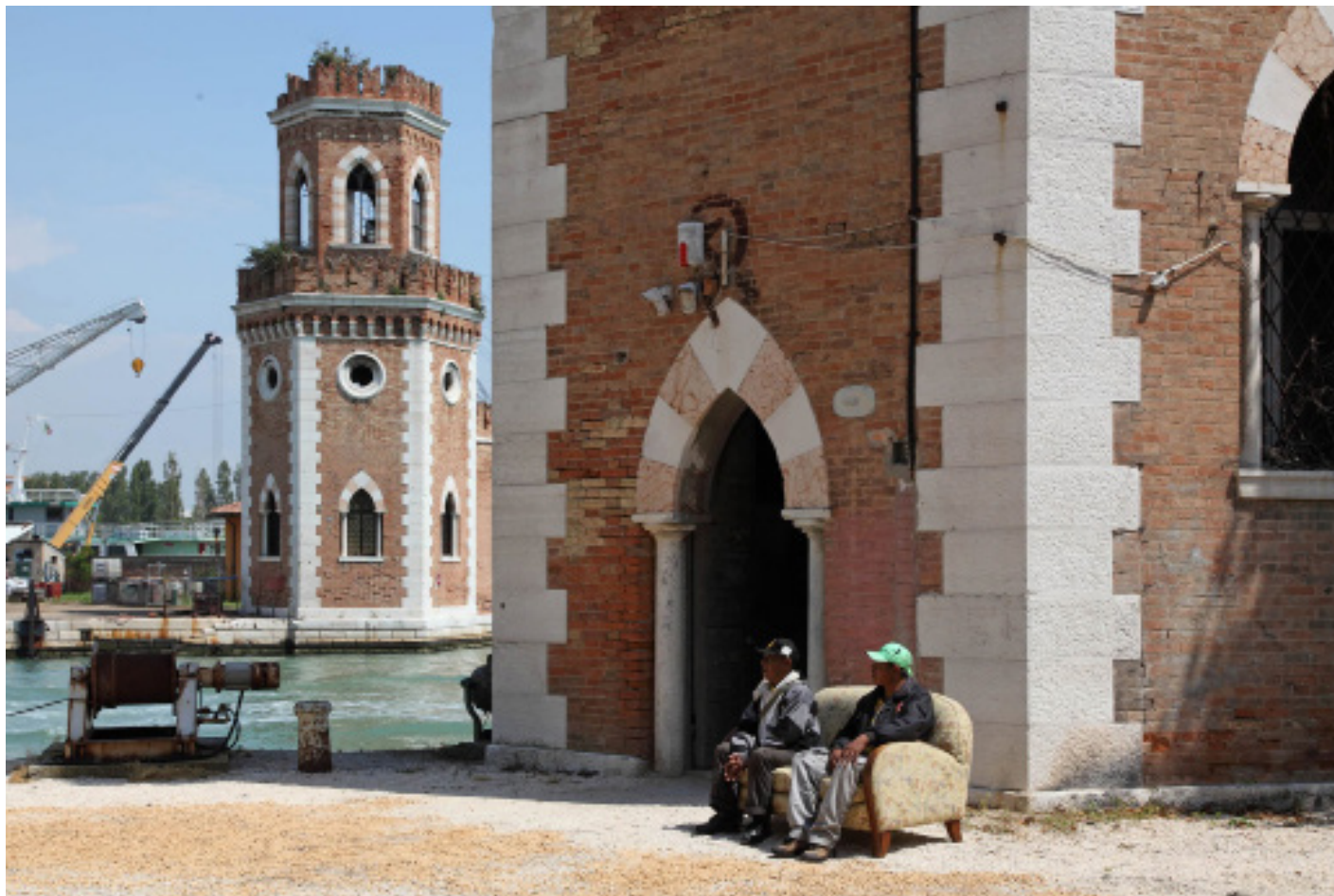
Fig. 9 – Paulo Nazareth, The Encyclopedia Palace , 2013. 55ª Biennale di Venezia.