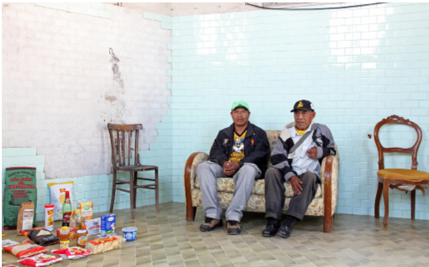
Fig. 8 – Paulo Nazareth, The Encyclopedia Palace , 2013. 55 a Biennale di Venezia.

Em sua produção, Paulo Nazareth recorre constantemente a uma dinâmica semelhante à arqueológica, na qual elementos culturais são coletados e agrupados de modo a tecerem sentidos específicos. Do mesmo modo, o som da reza kaiowá, a causa enfrentada por esta etnia, o líder filho do cacique e o pajé (Fig. 10) são caracteres encontrados pelo artista em seu caminhar. Ao viver segundo o desenvolvimento de suas obras, Nazareth nomeia o seu estilo de abordagem de «arte de conduta». Estes “achados”, assim, ao saírem de um terreno de restos materiais e se transportarem à instância viva da luta política, tornam-se «encontros», configurando um exemplar da postura do artista como etnógrafo.