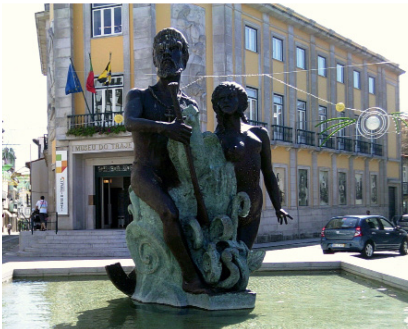
Fig. 6 – José Rodrigues, Caramuru , 2008. Bronze fundido, 500 cm de altura e 300 cm de largura. Imagem do monumento em 2011, instalado na Praça da República de Viana do Castelo. Atualmente a peça encontra-se na Praia Norte, Viana do Castelo.

Caramuru é o nome que foi dado a Diogo Álvares Correia, português nascido em Viana do Castelo em 1475, pelos tupinambá. Diogo Álvares naufragou no litoral do atual estado Bahia, Brasil, na primeira metade do século XVI, e terminou por casar-se com Paraguaçu, filha do chefe da tribo. A união deste casal simboliza a miscigenação entre povos radicalmente diferentes e a origem da nobreza cabocla. (...) É certo que a história de Caramuru e Paraguaçu reflecte o primado da visão europeia sobre o outro, pois a índia foi adaptada ao modelo de vida europeu, casando e baptizando-se como Catarina do Brasil. No entanto, a narrativa sobre a suposta fácil convivência entre portugueses e outros povos e principalmente a escolha de um personagem