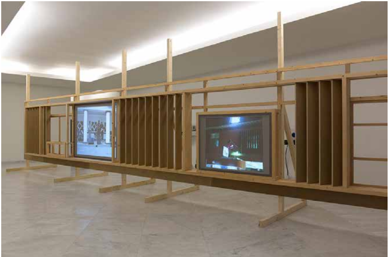
Fig. 6 - Ângela Ferreira. Indépendance Cha Cha, 2014 (Ecole nationale supérieure d'arts de Paris Cergy, 2022).

indica a potência que a hibridização matéria-visual detém. Também na entrevista realizada com a artista, Ângela Ferreira foi contundente em afirmar que classifica os seus trabalhos como Vídeo-Esculturas, uma vez que assim determina objetivamente os seus meios de trabalho, em oposição à palavra “instalação”, que a artista julga um termo mais “genérico” no contexto específico da arte contemporânea.