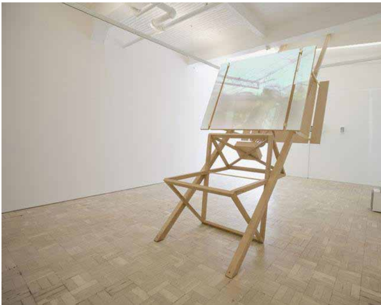
Fig. 5 - Ângela Ferreira. For Mozambique, 2008 (Michael Stevenson, 2022).

Assim, ao notar a habilidade da artista de nos transportar para certos períodos históricos através da arquitetura e do vídeo de forma a permitir a reflexão de tais situações,