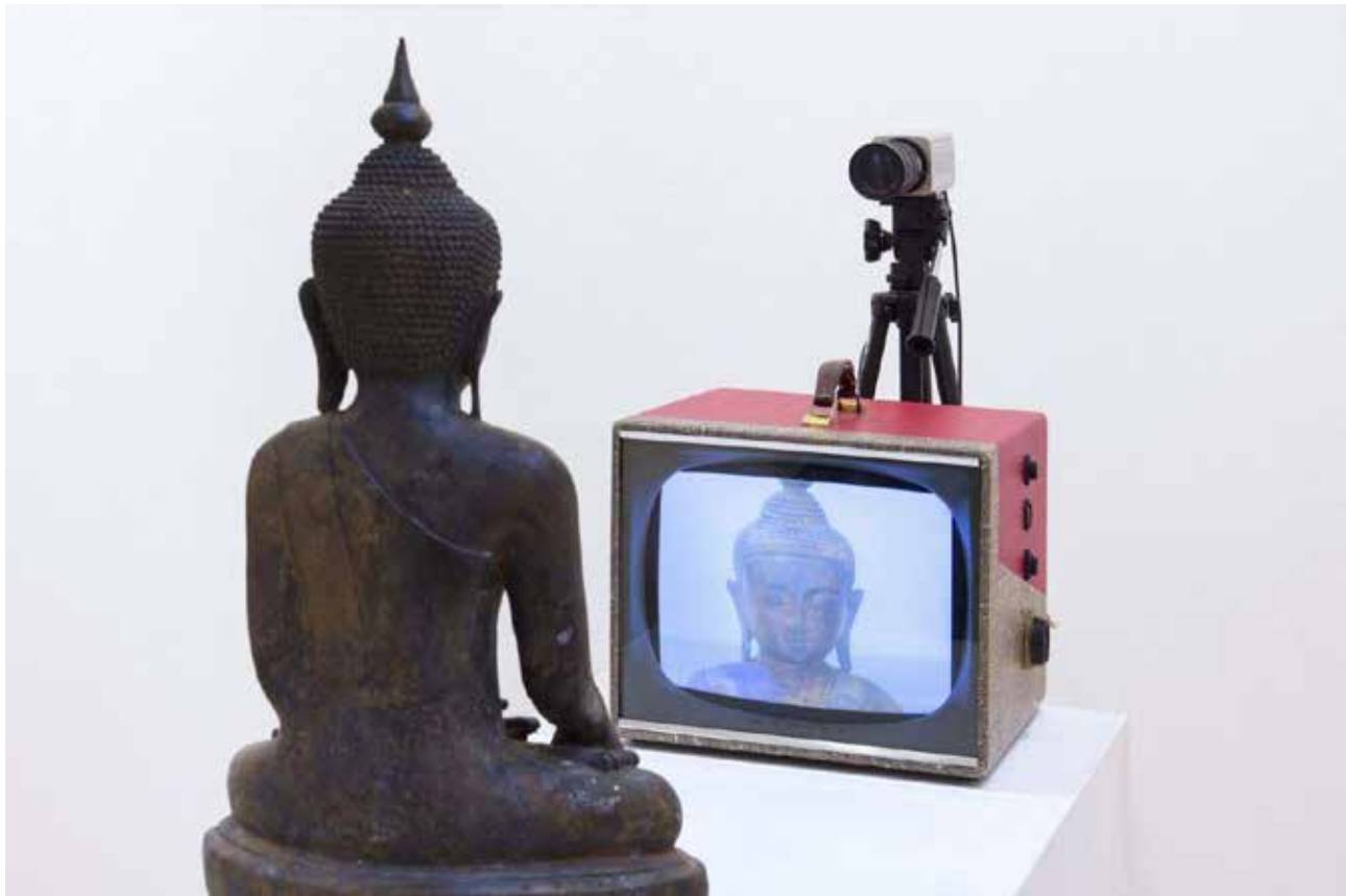
Fig. 2 - Nam June Paik. Tv Budha, 1976 (Art Basel, 2021).

importância fundamental na arte do pós-guerra, pois foi um dos pioneiros da Instalação, da Videoarte e do Happening segundo a biografia do artista no Museu Coleção Berardo (2021). Vostell integrou o movimento Fluxus, estando ligado à sua fundação com Nam June Paik, George Maciunas, entre outros.