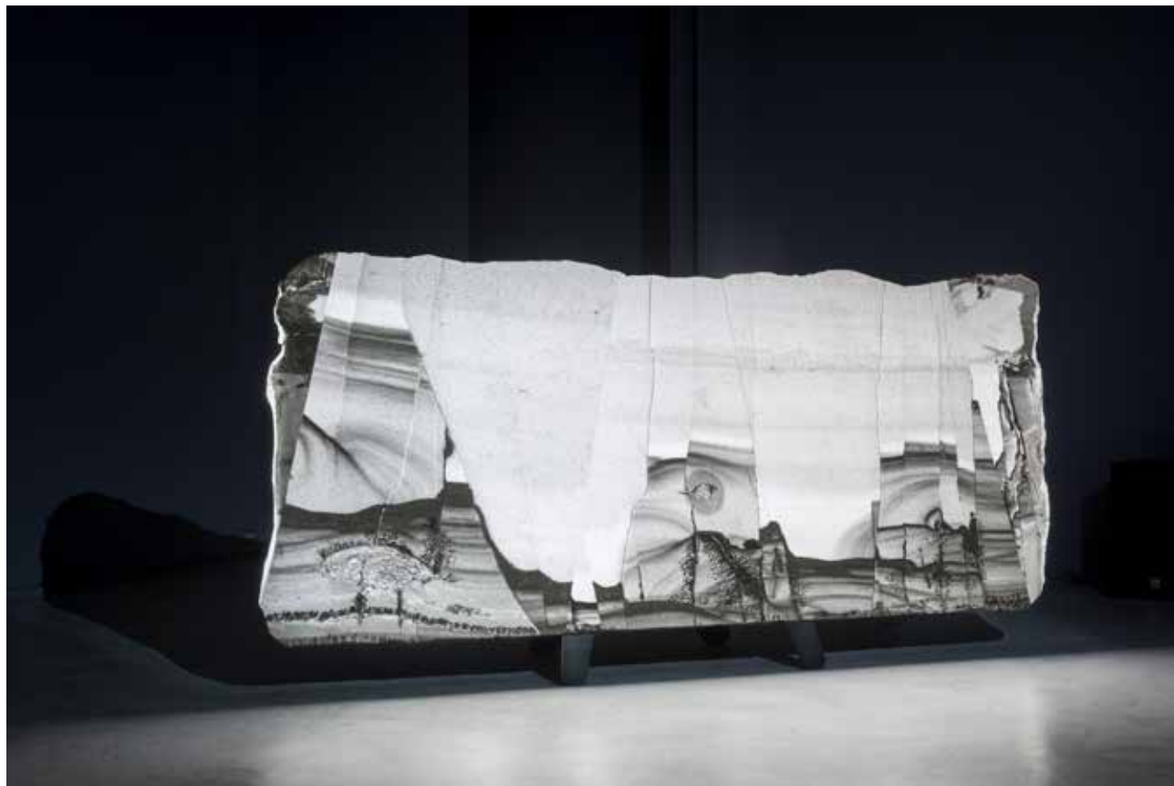
Fig. 4 - Alexandre Estrela. Ruin Marble, 2022 (Rialto 6, 2022).

Nesta obra, é especificamente a tela que em forma de pedra abriga as imagens projetadas de outra pedra, que dançam e se movem com o ritmo do som. Esta especificidade material que em consonância com o conteúdo imagético e sonoro configura a simbiose híbrida entre os elementos audiovisuais e escultóricos. Portanto, há várias interseções entre a materialidade e a imagem em movimento no trabalho de Estrela, as quais promovem inúmeras ressonâncias geradoras de incertezas e instabilidades na matéria e principalmente na sua percepção.