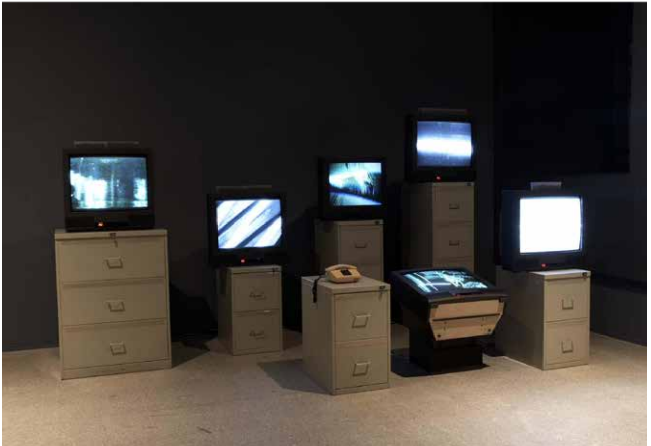
Fig.1 - Wolf Vostell. 6 TV Dé-coll/age, 1963 (Museu Reina Sofia, 2021)

Um dos artistas pioneiros na utilização do vídeo na arte foi Wolf Vostell. Nascido na Alemanha em 1932, teve