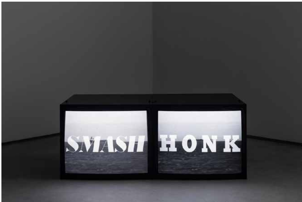
Fig. 8 - Henrique Pavão. Not Always Recovers From You, 2020 (Henrique Pavão, 2022).

relevante por ser uma clara elucidação entre as técnicas clássicas tanto da escultura como do vídeo. Isto faz dela uma obra instigante, principalmente por ser realizada num momento no qual a tecnologia destes meios na maioria das vezes tem optado por virtualizá-las através de exposições online e festivais de filme em streaming.